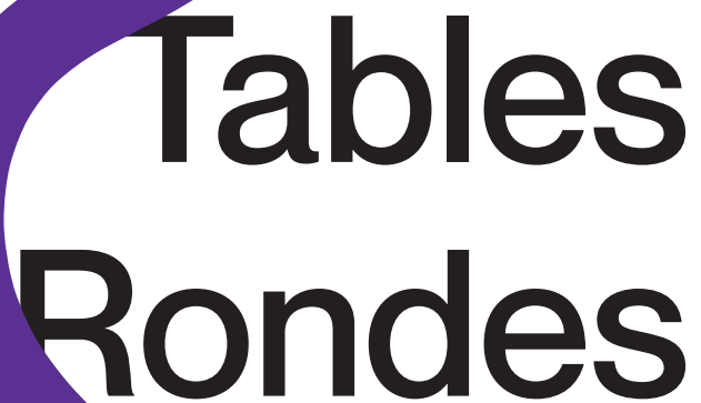
Table ronde 1

Thème : Les réseaux sociaux en bibliothèque